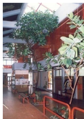
Слика 2. Ентеријер ИО

Основна школа "Кадињача" у Лозници организује редовну полудневну наставу у две смене. Смене се мењају месечно, јер се тако може најбоље организовати васпитно-образовни и други облици рада и због наставника који раде у другим школама. Такође, овакав систем распореда дневног рада примењује се и због тога што је школски намештај прилагођен узрасту ученика.